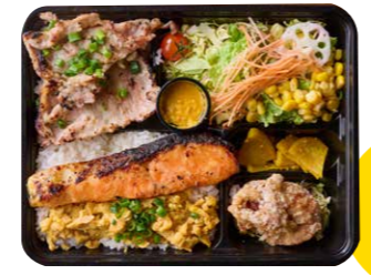
銀鮭の西京漬け&豚ロース塩麹炭火烧弁当