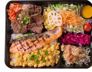
銀ジャケ西京漬け&和牛焼肉 W炭火烧弁当