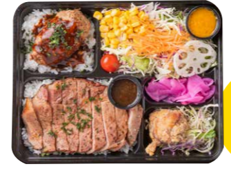
炭火烧ローストポーク&デミハンバーグ弁当