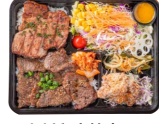
上州和牛焼肉&炭火烧ローストポークBOX弁当