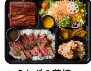
うなぎの蒲焼&上州牛サーロイン豪華弁当