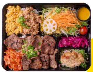
上州和牛炭火烧肉&鶏そぼろ弁当