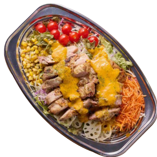
パーティーグリル チキンサラダ ¥1980 税込