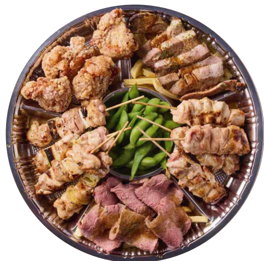
バラエティオードブル ¥4000 税込