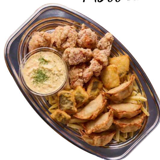
フリッター盛り合わせ ¥2380 税込