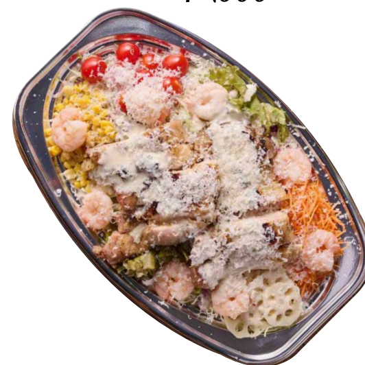
パーティーエビ&グリチキ チーズシーザー ¥2280 税込