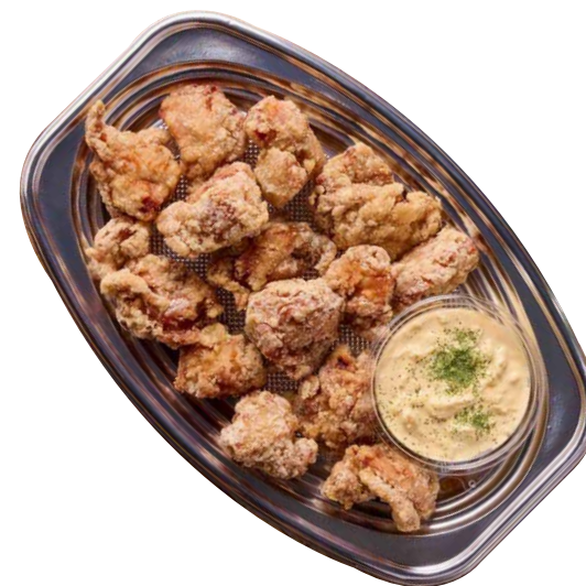
パーティー金賞唐揚げ タルタル付 (唐揚げ600g) ¥1980 税込