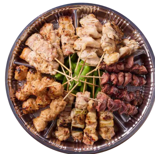
焼き鳥オードブル (20本 枝豆) ¥4000 税込