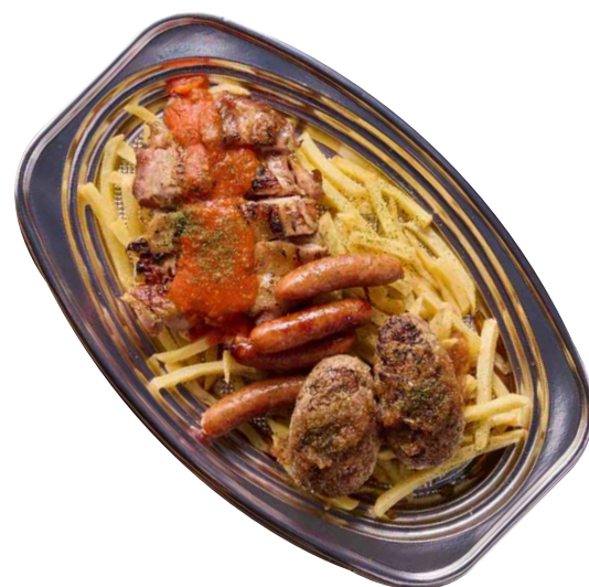
パーティーMIXグリル ¥1980 税込