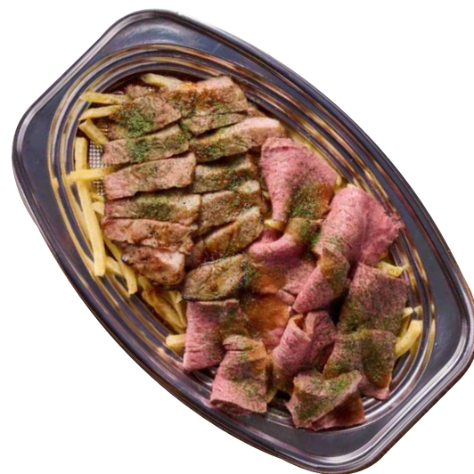
上州牛&上州麦豚 相盛りロースト ¥2980 税込