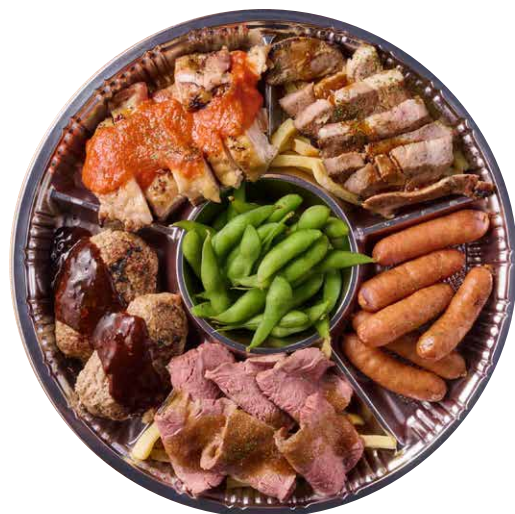
5種のキングミート オードブル ¥4500 税込